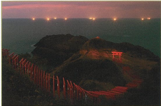
日本列島文学の旅